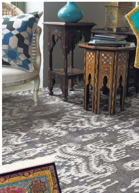
In Nadelmalerei-Technik wurde Teppich „Bamboo Ikat“ gefertigt, 610 Euro/qm (The Rug Company)