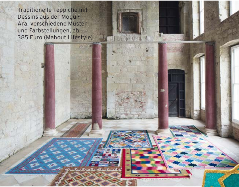
Traditionelle Teppiche mit Dessins aus der Mogul-Ära, verschiedene Muster und Farbstellungen, ab 385 Euro (Mahout Lifestyle)